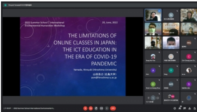
↑ 夏日學校工作坊「The Changing World: How to Achieve Sustainability in the Pandemic Era」

2022 ARCHS' Workshop for International Environmental Humanities在接下來至6月26日接力由法政學院及文學院的夏日學校課程陸續登場。最後感謝中興大學國際事務處協助曝光宣傳及支持。