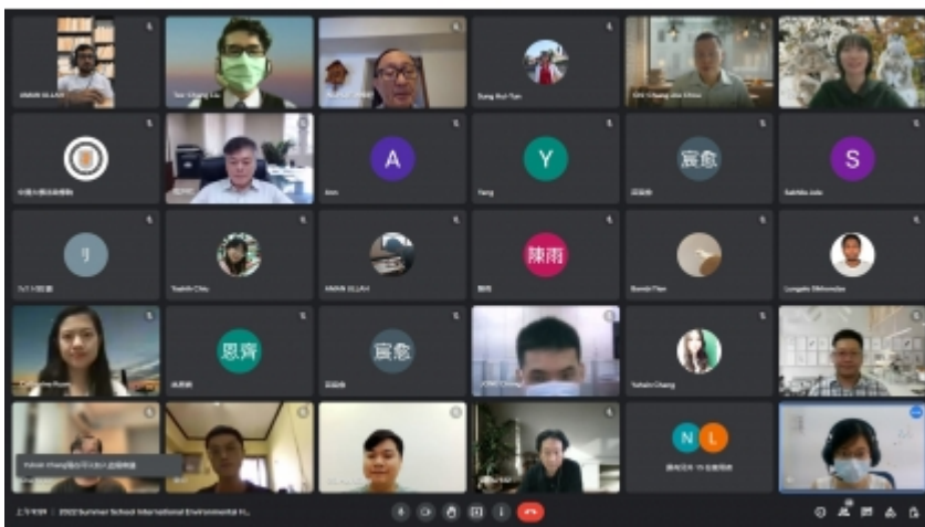
↑ 夏日學校工作坊「The Changing World: How to Achieve Sustainability in the Pandemic Era」