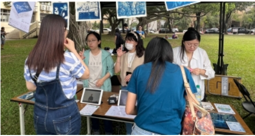
↑ 由興大USR團隊教師結合公益市集一起擔任闖關關主