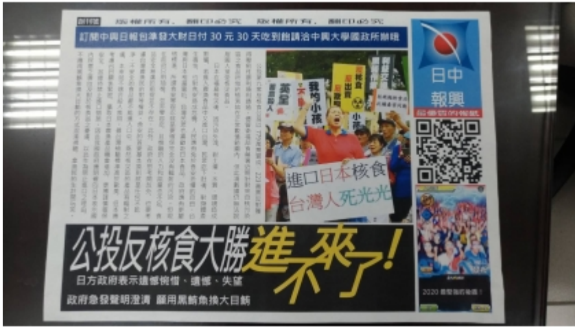
↑ 學生製作報紙新聞稿