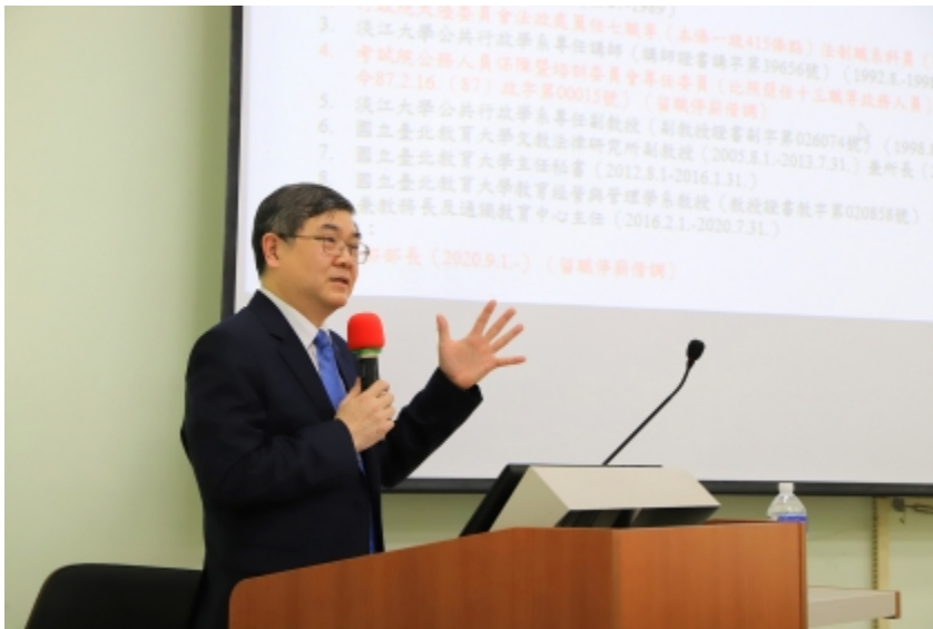
↑ 銓敘部周志宏部長演講公務員法制新近變革與未來研修方向

聲，周部長仍不忘期勉在場法政學子能將公務員納入職涯規劃考量，盼未來能有更多法政人才注入國家行政機關，並期許透過建置完善之公務人員相關法制，納入各專業領域人才為公部門效力。